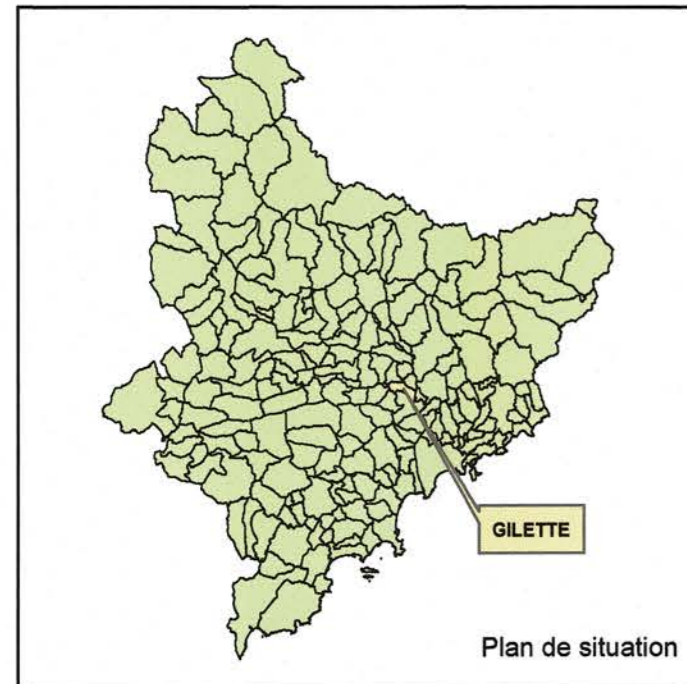
Plan de situation

Pour le préfet, Secrétaire Général Philippe LOOS Philippe LOOS Mai 2022